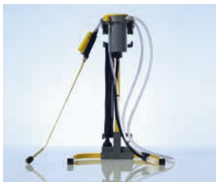
Pompa pentru canistre MC-Pump 1