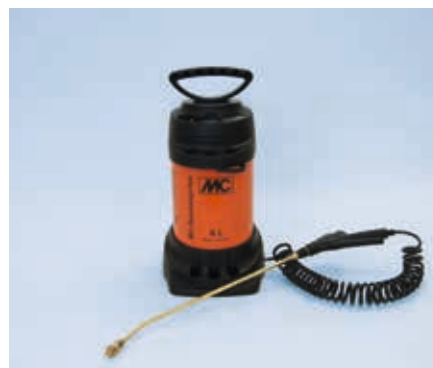
Pompa manuală MC-Spezialspritze