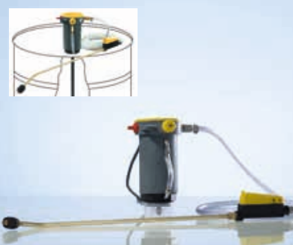
Pompa pentru butoi MC-Pump 2